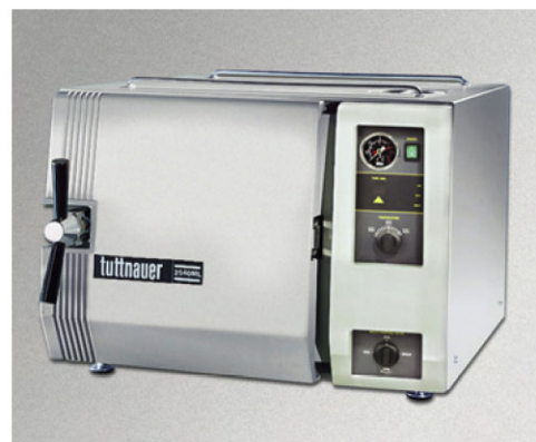
● 2540 ML